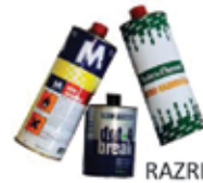
RAZREDČILA IN TOPILA