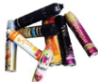
SPREJI IN RAZPRŠILA